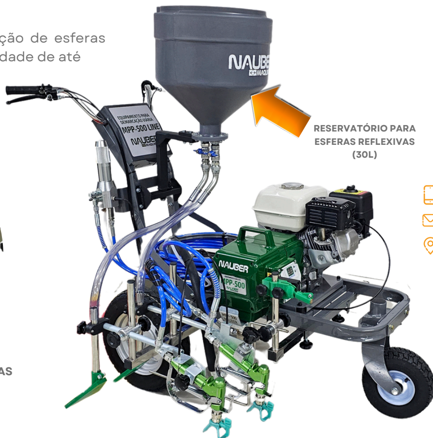
RESERVATÓRIO PARA ESFERAS REFLEXIVAS (30L)