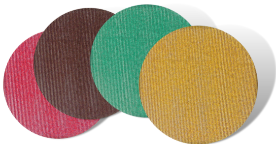
COMPATIBLE CON PAPELES DE LIJA DE 125 MM Y 5"